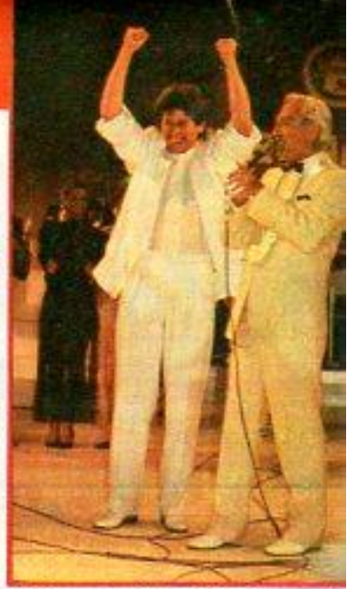
Neco, sevinçten havalara uçtu İlk kez yapılan müzik yarışmasında "Sos how" adlı şarkısıyla birinciliği elde eden 1. co. ödülünü alırken göz yaşlarını tutamadı